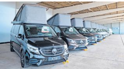
Auf der Ausstellungsfläche an der Münchwiese stehen derzeit Mercedes-Benz Marco Polo für den Verkauf.

züge, Lieferwagen und Omnibusse. Auch mit dem Hersteller Käsbohrer (München) wurde man handelseinig. Die Geschäftsleitung des Unternehmens übernahm der Gründungsgesellschafter Hans-Günther Oppermann, 1995