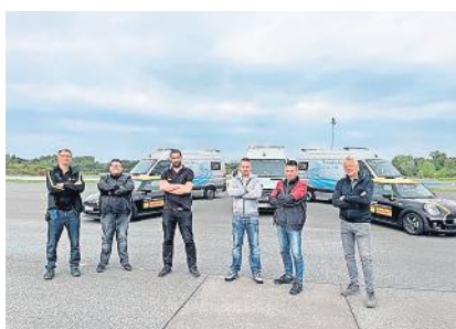
Genießen einen gemeinsamen Tag auf dem ADAC-Fahrsicherheitsgelände: das ausgezeichnete Service 24h-Team.

Mercedes-Benz schrieb dazu: Mit viel Engagement und Professionalität gelingt es KTW, das