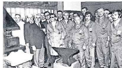
Die Mitarbeiter der Firma KTW bei der Firmengründung vor 50 Jahren.