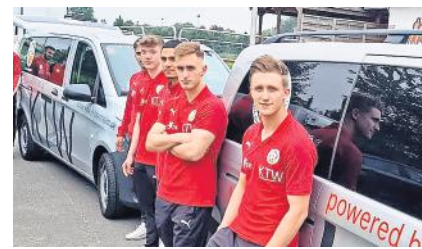
Nutzen vier KTW-Busse für ihre Auswärtsfahrten: die Spieler des Regionalligisten VfV Borussia 06 Hildesheim.