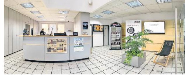
Hell, freundlich, modern: der Empfangsbereich im KTW-Stammsitz in der Carl-Zeiss-Straße in Hildesheim.

attraktive Finanzierungsmodelle. KTW ist eine Werkstatt nicht nur für Lkw, sondern auch für Pkw. Das Unternehmen ist Partner von „ad Autodienst – Die Markenwerkstatt“, einem Verbund freier Werkstätten. Dadurch kann KTW in dem Verbund als Großekäufer entsprechend günstige Ersatzteile von renommierten Markenherstellern kaufen. Ein Vorteil für Unternehmen und Kunden. Seit einigen Jahren bietet KTW auch Autos für mobilitätseingeschränkte Personen an. In diesen Autos können Menschen, die auf einen Rollstuhl angewiesen sind, problemlos mitfahren. KTW baut die Modelle Citan, Viano und Sprinter um. Dazu arbeitet das Unternehmen mit Bausätzen des Firma AMF, dem größten Anbieter in Norddeutschland. Der Vorteil: „Wir haben bei uns fertig umgebaute Fahrzeuge stehen. Normalerweise dauert ein Umrüsten drei Monate.“ Der Kunde kann einen entsprechend umgebauten Wagen also vor Ort ausprobieren und gegebenenfalls sofort mitnehmen. KTW baut pro Jahr etwa 70 Fahrzeuge für Rollstuhlfahrer um. Außerdem gibt es Wohnmobile im V-Klasse- und Vito-Bereich in großer Auswahl. Ein weiteres Standbein im breitgefächerten Angebot ist die Flottenpartnerschaft mit Reifen+. Damit können die Fahrzeuge aller wichtigen Flottenbetreiber wie etwa Daimler Fleet Management, Sixt Leasing oder Deutsche Leasing zum Reifenwechsel, Unfallinstandsetzung oder Fahrzeugcheck gefahren werden.